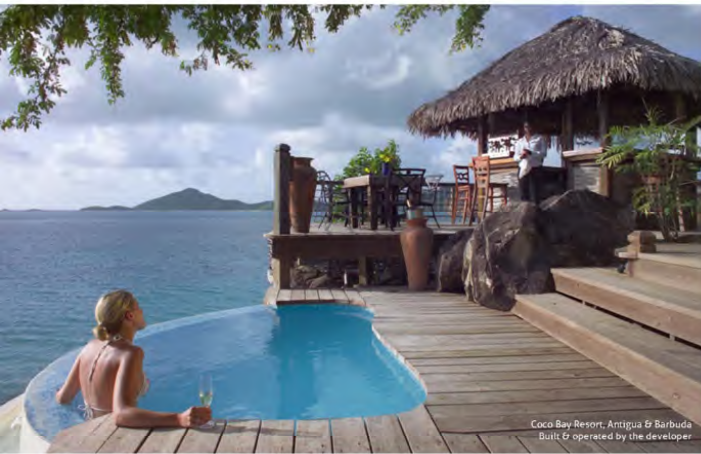
Coco Bay Resort, Antigua & Barbuda Built & operated by the developer