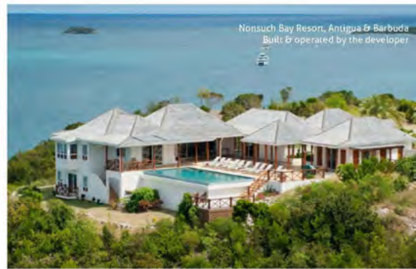
Nonsuch Bay Resort, Antigua & Barbuda Built & operated by the developer