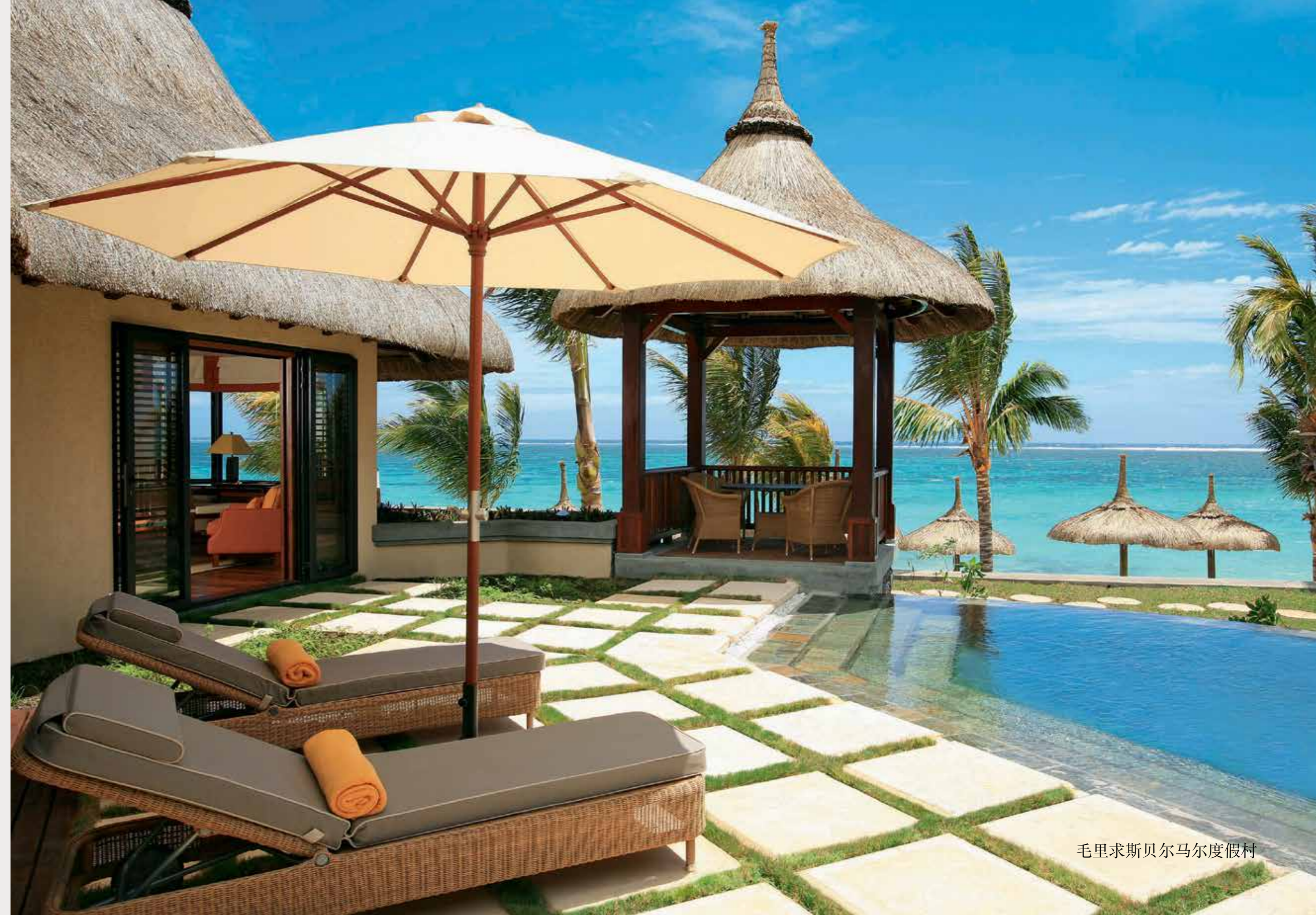
毛里求斯贝尔马尔度假村

这种特殊的理念融合到他们承揽的每一个项目中。SCI也有幸与许多世界顶尖的酒店运营商合作，包括凯宾斯基、凯悦国际酒店集团、丽思卡尔顿及万豪等。