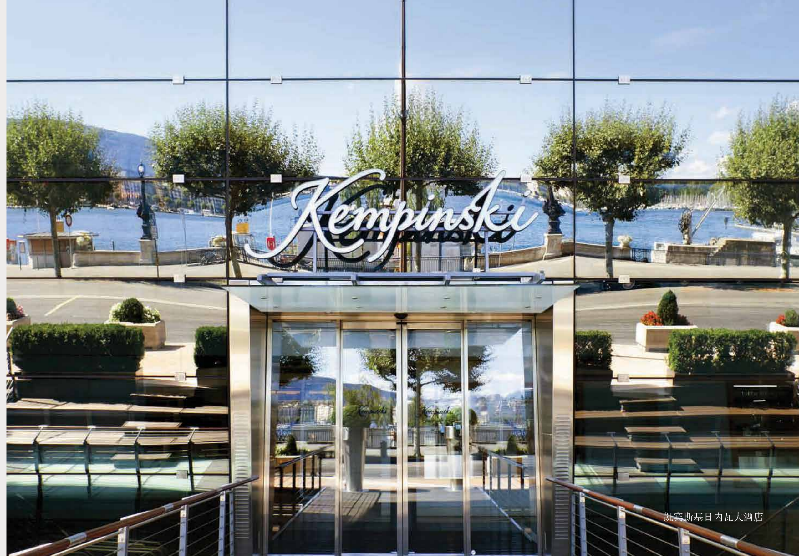
凯宾斯基日内瓦大酒店

Range开发有限公司与全球顶尖品牌合作， 共同开发多米尼克卡布里凯宾斯基度假酒店