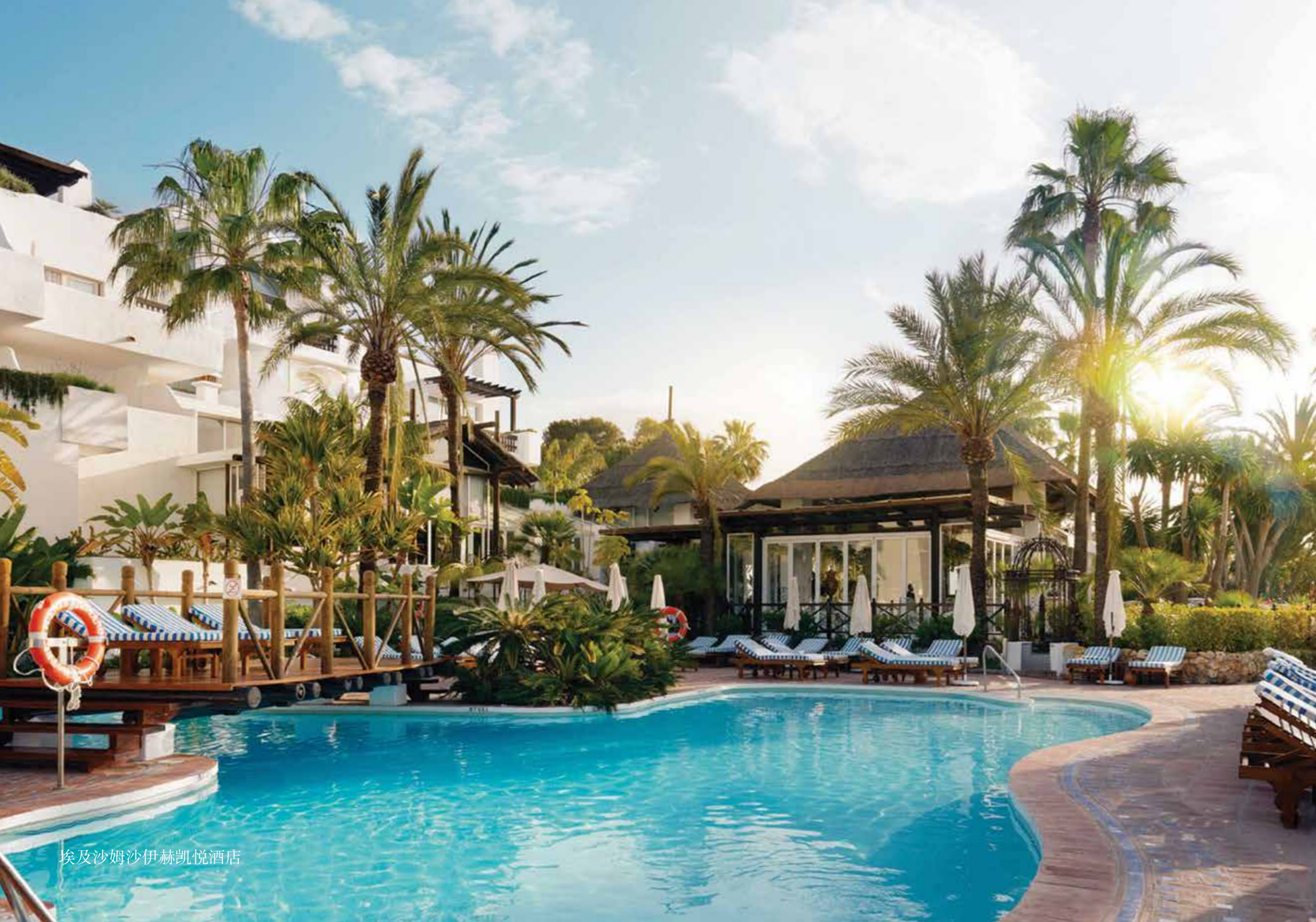
埃及沙姆沙伊赫凯悦酒店