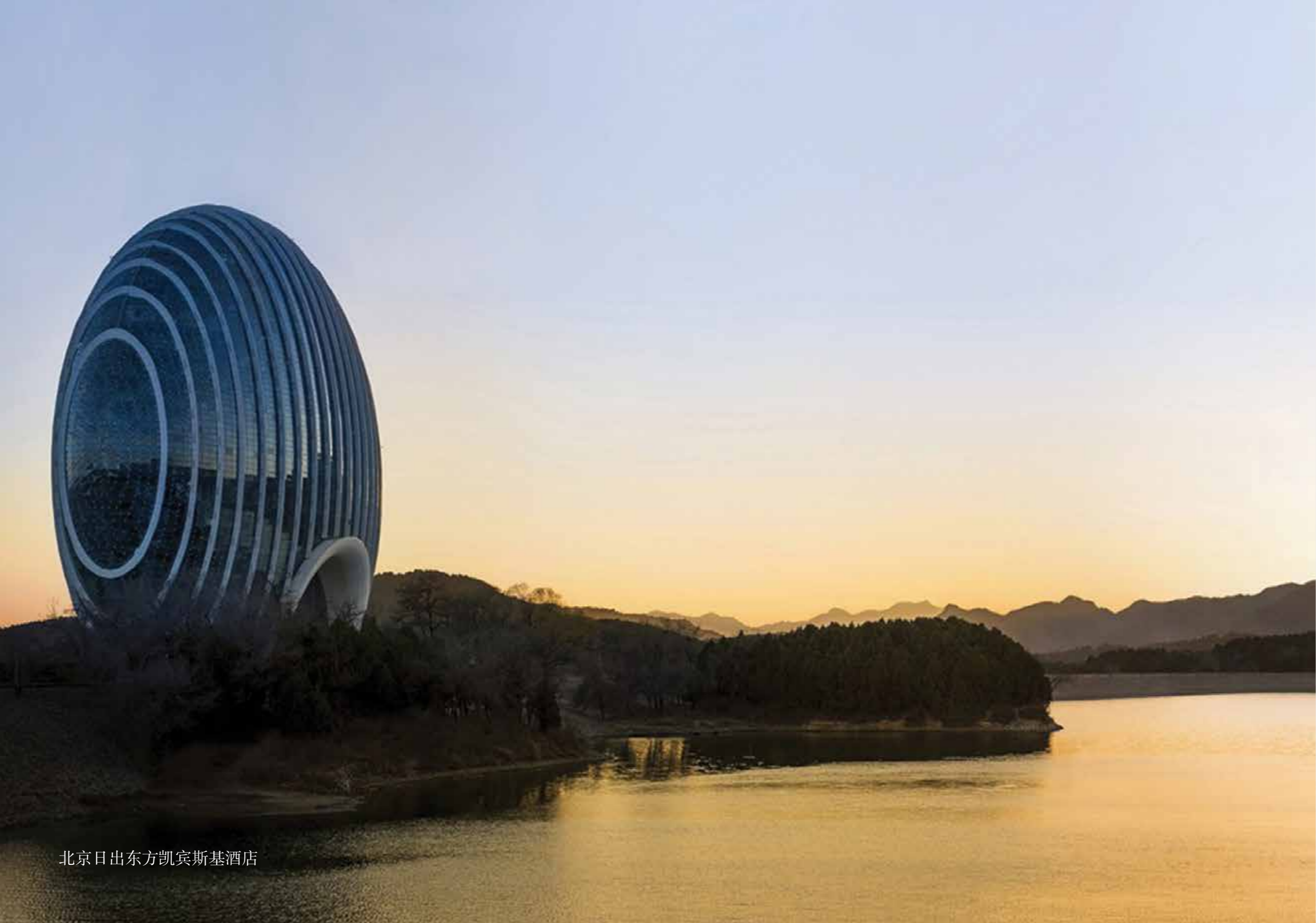
北京日出东方凯宾斯基酒店