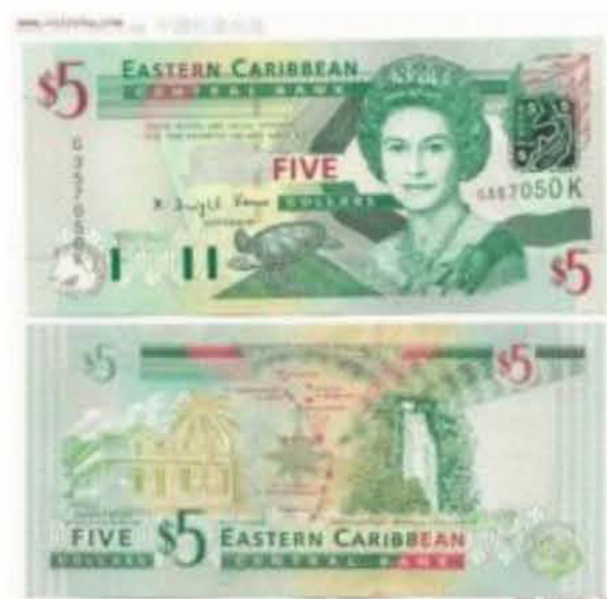
(圣基茨和尼维斯货币)

圣基茨和尼维斯是一个人均收入中等偏上的国家。旅游业是国民经济主要支柱产业,外汇收入的主要来源。近年来,圣政府为使经济多样化,重视发展轻工业和旅游业。