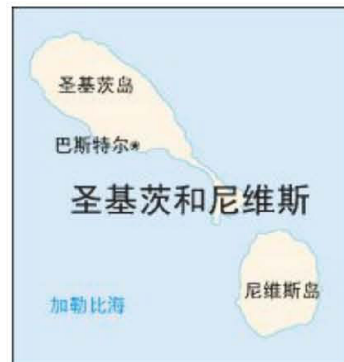
(圣基茨和尼维斯地图)

1997年7月8日,议会批准组建正规军队,并成立一个由总理、总理指定的部长及部队指挥官组成的指挥部,总理任司令。1998年国家安全预算约为2380万东加元。参加了1982年由美国赞助建立的地区安全体系。