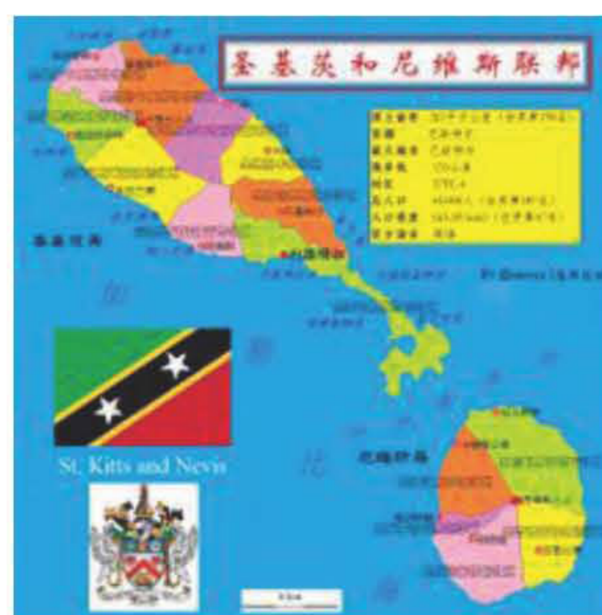
(圣基茨和尼维斯行政区划图)