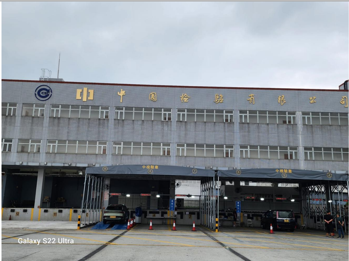
Galaxy S22 Ultra