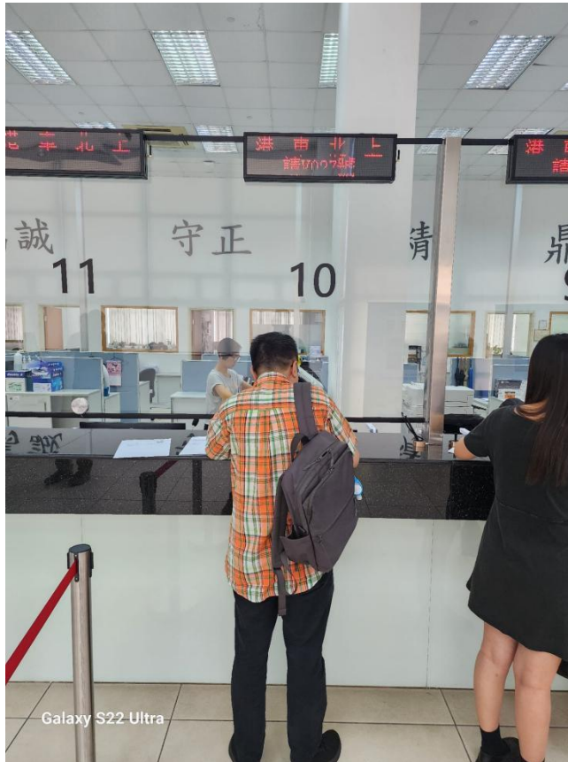
Galaxy S22 Ultra

車輛牌照 MOTOR VEHICLE LICENCE 牌照屆滿日期 Licence Expires 2023 類別 Class PRIVATE CAR 登記號碼 Registration Mark 9 廠名 Make TOYOTA 底盤號碼/車輛識別號碼 Chassis No./V.I. No. 出廠年份 Year of Manufacture 2005 顏色 Colour BLACK 單位附載 Seating Capacity 6 額定功率 Rated Power 許可車輛總重 P. Gross Vehicle Weight 許可組合式車輛總重 P. Gross Combined Weight 許可最高車軸重量 P. Max. Axle Weight 自訂登記號碼的英文字母及數目字的排列方式(雙行) Arrangement of letters and numerals for Personalized Registration Mark in 2 rows 牌照條件 Conditions of Licence 檔案記錄 Transaction 發出日期 Date of Issue