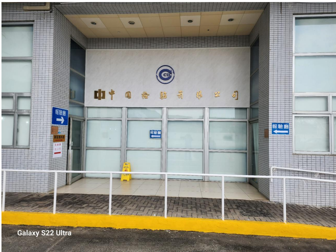
Galaxy S22 Ultra